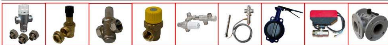
Válvula Mez. 3 vías.