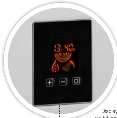
Display digital con selector de temperatura